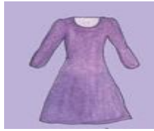
b) Une r _ b _