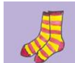
e) Des c _ a _ s _ e _ t _ s