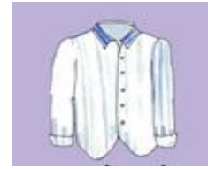
c) Une c _ e _ i _ e