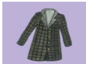
d) Un m _ n _ e _ u