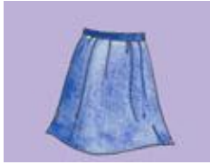
a) Une j _ p _

Complétez les mots de vocabulaires sur les vêtements (Complete the words of the vocabularies on clothes.)