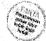
URAT ayam sembelih di jenajit halal rayu di Putrajaya.

Sementara itu, peniaga jenajit halal di Kuala Lumpur, Selangor dan Putrajaya, sering kali menjual ayam yang masih berdarah. Selain itu, talas ayam yang dipotong juga masih mempunyai ciput darah. Seramita, peniaga jenajit halal di Kuala Lumpur, berkata, dia melihat talas ayam yang dipotong masih mempunyai ciput darah.