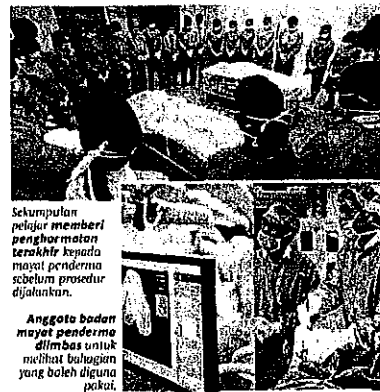
Sekumpulan pelajar memberi penghormatan terakhir kepada mayat penderma sebelum prosedur dijalankan.

"Antara aspek utama yang diuji adalah keupayaan mereka menyalami, memahami perasaan atau emosi orang lain walaupun individu itu sudah tidak bernyawa lagi," katanya.